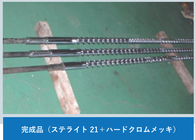
完成品（ステライト 21+ハードクロムメッキ）